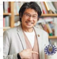
クウジツ株式会社