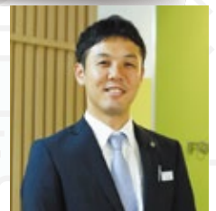
株式会社フォレスト コーポレーション