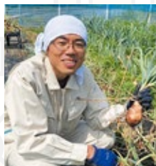
岩手県一関市 地域おこし協力隊