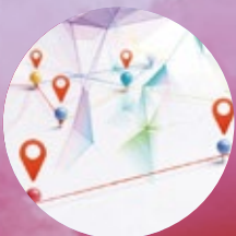
友達最強ネットワーク