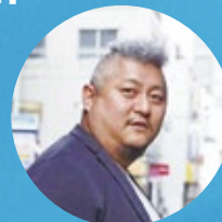
グー・チョキ・ハートナース株式会社 新虎小屋