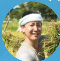
株式会社MerryCreator 麻布島崎屋