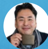
MCG ギルド・マスター 事業脚本家*