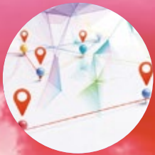
友達最強ネットワーク