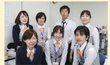
女性が働きやすい職場環境が確保されています

「現在、当社にはアルバイトや派遣社員を含め約30,000人が在籍しています。この約30,000人が我々のブランド。適正な利益を確保しながら、最もがんばっている先端の人材がいかに満足できるビジネスを達成できるように注力しています」