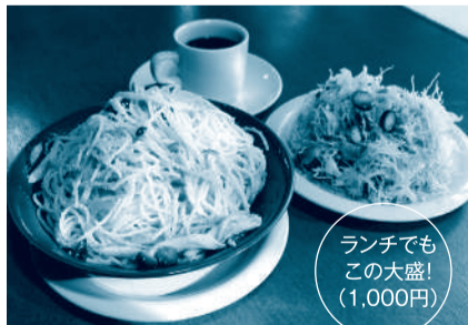
ランチでもこの大盛! (1,000円)

スパゲッティは全種類、一般的な1人前の量の、2倍近い180グラムもあります。この「大盛」が男性客には大好評で、同店のいちばんの「売り」になっています。女性客の3分の1は残して帰るそうです。40人程座れる店内は、ノスタルジックな雰囲気を出し、常連客たちは、夜な夜なワイン片手に芳醇なイタリアンに舌鼓を打って盛り上がります。