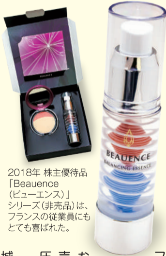
2018年 株主優待品「Beauce(ビューエンス)」シリーズ(非売品)は、フランスの従業員にもとても喜ばれた。

2004年、同社はジャスダック証券取引所に株式を上場し、現在は東京証券取引所に上場しています。OEM、ODMの分野での上場は、世界的に見ても韓国のみと社だけだ。