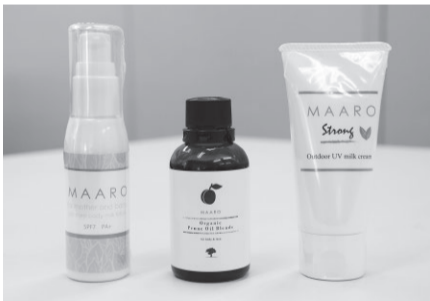
左から、MAARO アロマミルクローション、オーガニックブルーブレンドオイル、MAARO STRONG アロマミルククリーム。MAARO STRONG アロマミルククリームでは、試行錯誤の末、自然由来原料99%配合を実現。