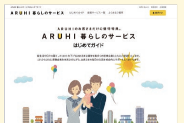
「暮らしのサービス」は、ARUHI住宅ローンを借り入れしている場合、年会費無料で利用することができる。

ました。それが他企業の協力も得て実現した「ARUHI暮らしのサービス」です。引越しやハウスサービスはもちろん、家電やインテリア、食生活、旅行、美容・健康に至るまで多岐にわたってお得なサービスが受けられ、これらを有効に使うことができれば生活コストを抑えることが可能という当社独自のシステムです。一方、サービスを提供してくれる企業も弊社の密度の濃い顧客データベースを活用したいという願いがあり、