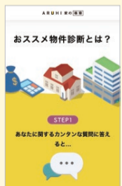
「おススメ物件診断」では、家賃や年齢など簡単な質問に答えるだけで、条件に合う物件が提示される。

「この会社にも企業文化というものがあると思いますが、弊社ではチームワーク、スピードということを大切にしています。平均年齢が37歳の若い会社ですから、スピード感があって仕事が早いのは弊社の強みです。住宅ローンというものは書類が多く、複雑な事務手続きを伴いま