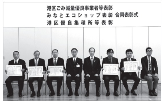
2月10日開催 ごみ減量優良エコショップ表彰式

「みなとエコショップ」認定店、取組活動等については、港区ホームページで紹介しています。